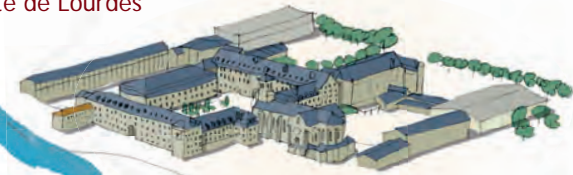
INSTITUTION SAINT-GABRIEL- SAINT-MICHEL