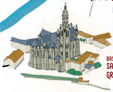
BASILIQUE SAINT-LOUIS-MARIE GRIGNON DE MONTFORT