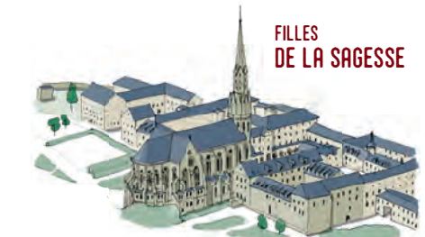
FILLES DE LA SAGESSE